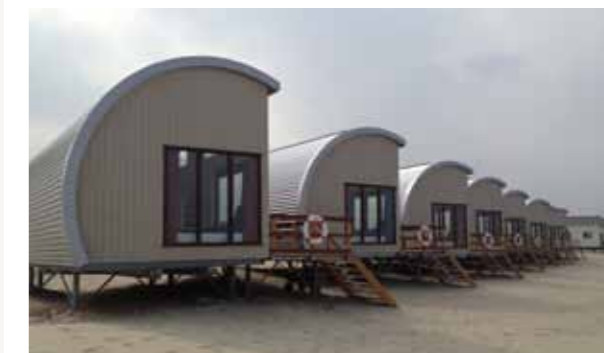
Een onvergetelijke ervaring!

Koningin Emmaweg 16A info@oranjezon.nl 4354 KD Vrouwenpolder www.noordzeehuisjes.nl +31 (0)118-591549